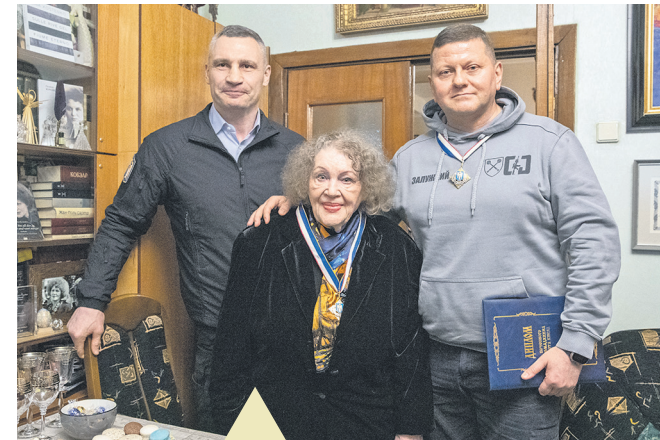
Ліна Костенко та Валерій Залужний тепер - почесні громадяни столиці – читайте на стор. 3